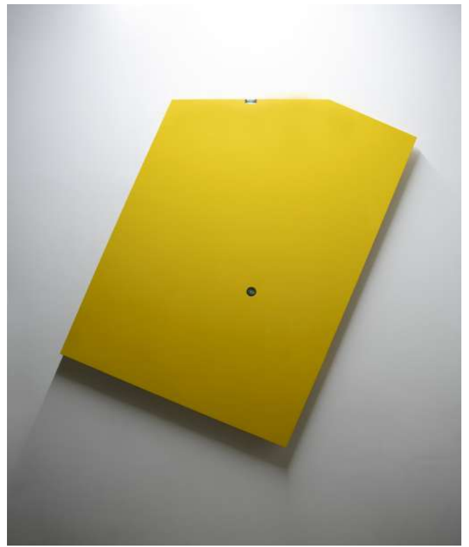
《Horizontal Pentagon (水平の五角形)》2020 キム・ミョンボム