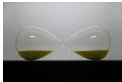
《Horizontal Time (水平の時間)》2020 キム・ミョンボム