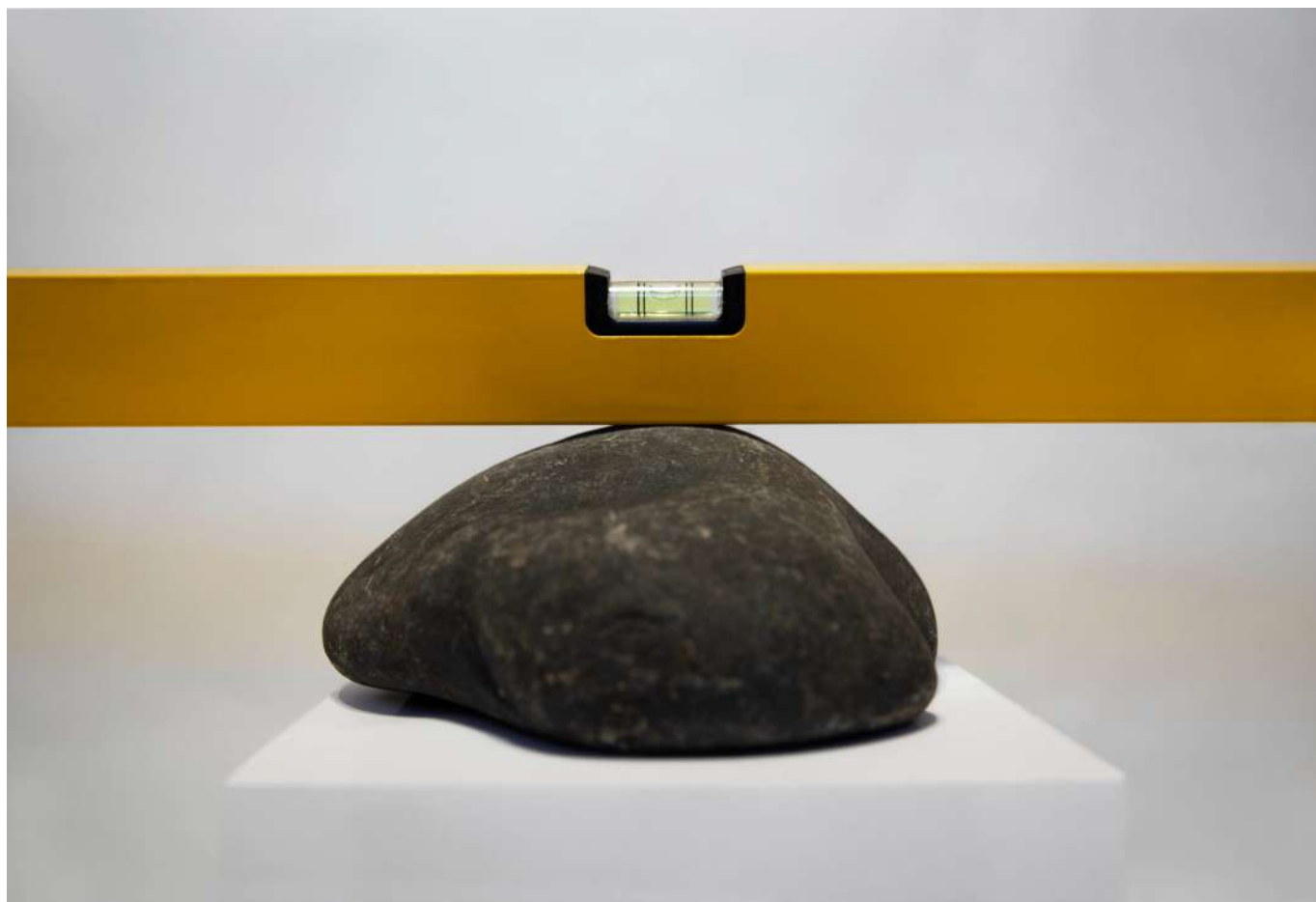
《Horizontal Stone (水平の石)》2020 キム・ミョンボム